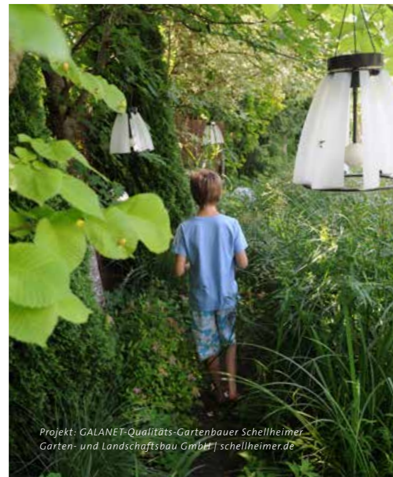
Projekt: GALANET-Qualitäts-Gartenbauer Schellheimer Garten- und Landschaftsbau GmbH | schellheimer.de