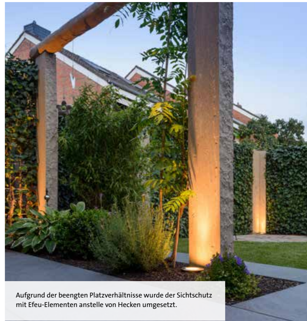
Aufgrund der beengten Platzverhältnisse wurde der Sichtschutz mit Efeu-Elementen anstelle von Hecken umgesetzt.

Falko Werner Garten- und Landschaftsbau GALANET-Partner seit 2005