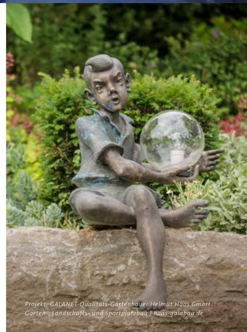
Projekt: GALANET-Qualitäts-Gartenbauer Helmut Haas GmbH Garten-, Landschafts- und Sportplatzbau | haas-galabau.de

Um Ihren Garten auch nach Einbruch der Dunkelheit weiter strahlen zu lassen, muss nicht die gesamte Fläche beleuchtet werden. Perfekt geplant und fachmännisch umgesetzt, tanzen Licht und Schatten leichtfüßig über Grünflächen, Blumenbeete, Terrassen und Wasseroberflächen.