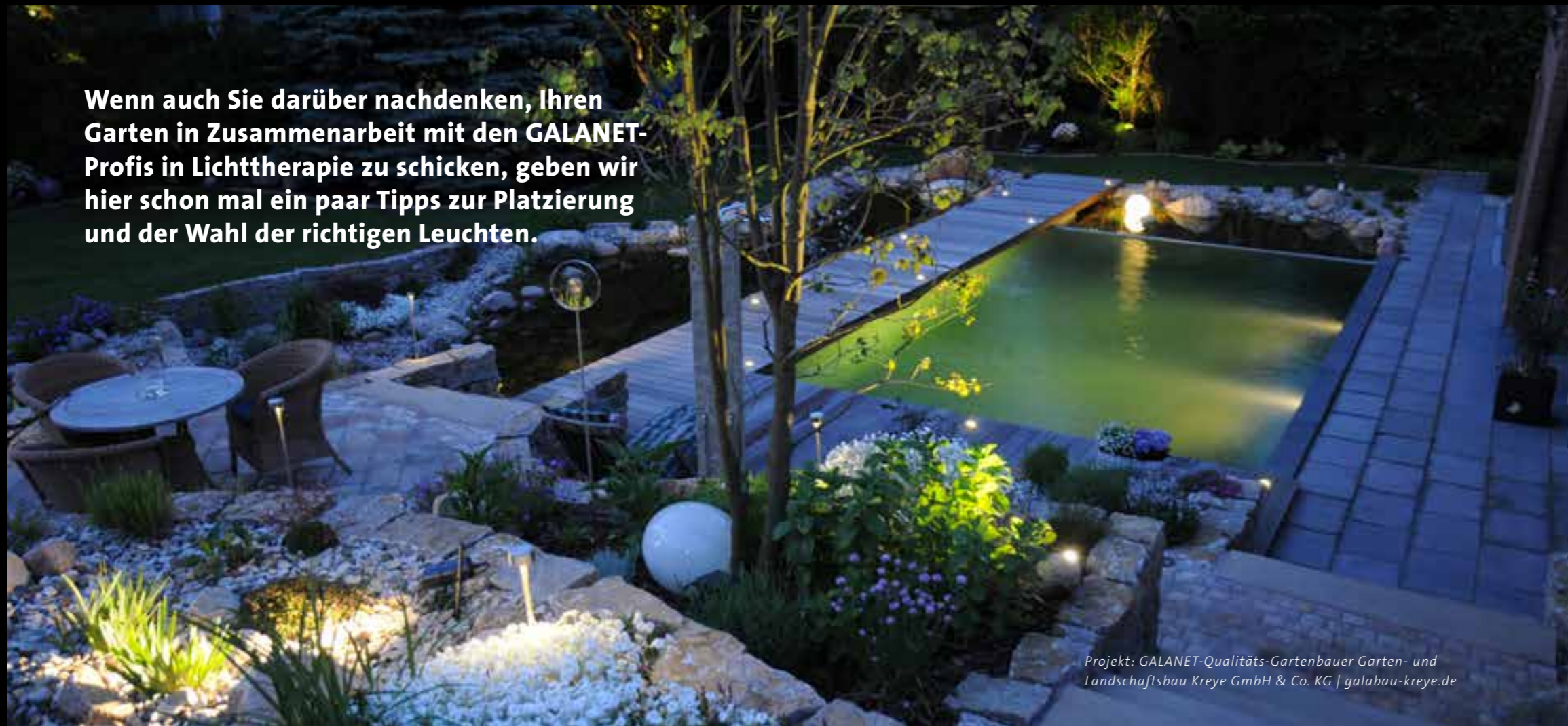
Projekt: GALANET-Qualitäts-Gartenbauer Garten- und Landschaftsbau Kreye GmbH & Co. KG | galabau-kreye.de

Wenn auch Sie darüber nachdenken, Ihren Garten in Zusammenarbeit mit den GALANET-Profis in Lichttherapie zu schicken, geben wir hier schon mal ein paar Tipps zur Platzierung und der Wahl der richtigen Leuchten.