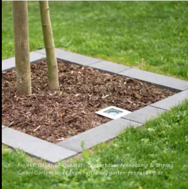
Projekt: GALANET-Qualitäts-Gartenbauer Pennekamp & Bisping GmbH Garten- und Landschaftsbau | garten-pennekamp.de

Das Set ist Ihr Garten, Pflanzen und Skulpturen haben die Hauptrolle übernommen. Um einzelne Elemente Ihres Außenbereiches filmreif in Szene zu setzen, eignen sich Spots am besten. In Bodennähe installiert, bringen Sie Kunstobjekte, elegant gewachsene Baumstämme und voluminöse Büsche im Dunkeln groß raus.