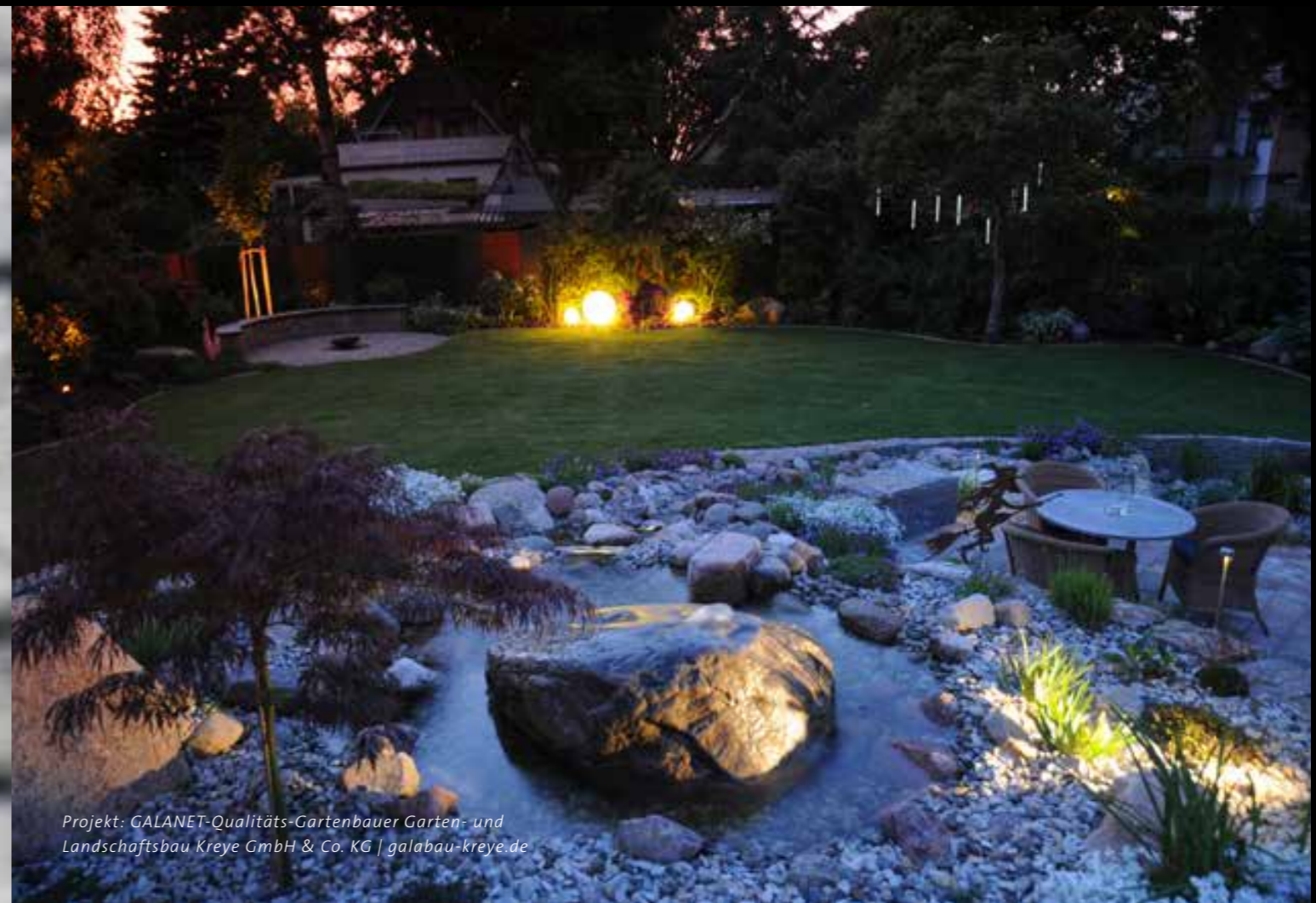
Projekt: GALANET-Qualitäts-Gartenbauer Garten- und Landschaftsbau Kreye GmbH & Co. KG | galabau-kreye.de