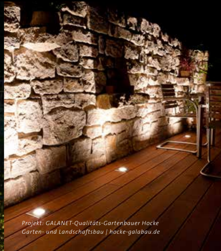
Projekt: GALANET-Qualitäts-Gartenbauer Hocke Garten- und Landschaftsbau | hocke-galabau.de