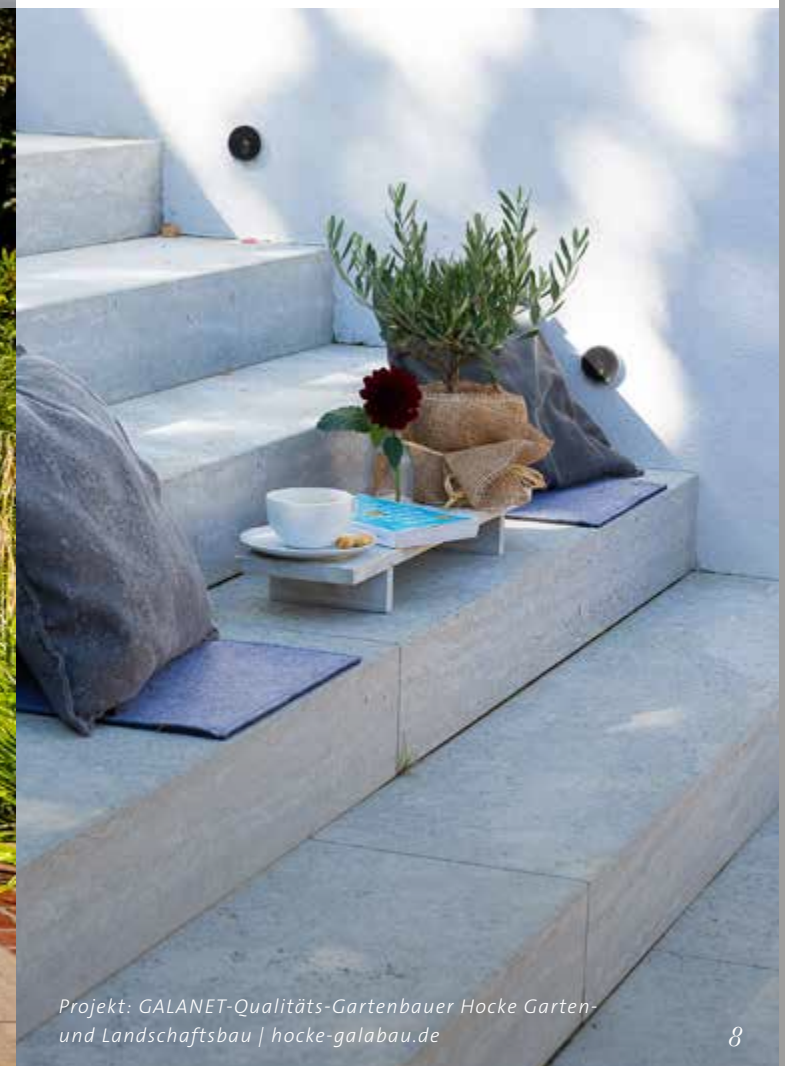
Projekt: GALANET-Qualitäts-Gartenbauer Hocke Garten- und Landschaftsbau | hocke-galabau.de