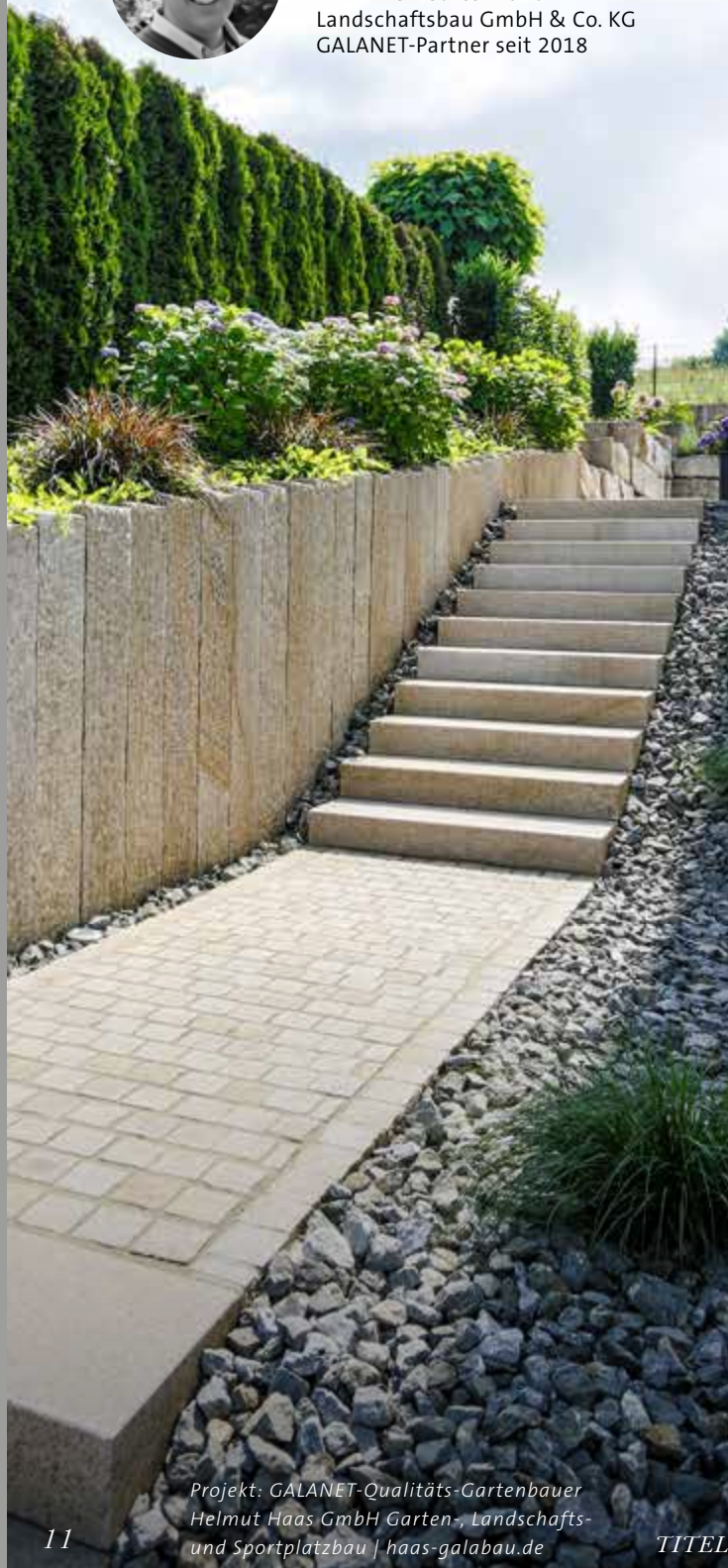
Projekt: GALANET-Qualitäts-Gartenbauer Helmut Haas GmbH Garten-, Landschafts- und Sportplatzbau | haas-galabau.de

TERWIEGE Garten- und Landschaftsbau GmbH & Co. KG GALANET-Partner seit 2018