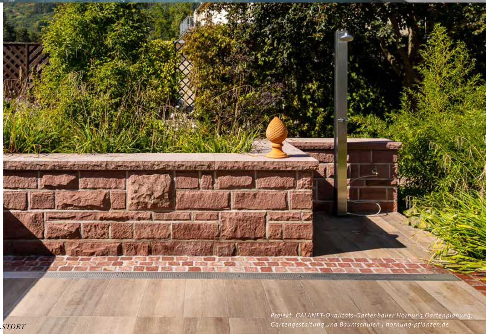
Projekt: GALANET-Qualitäts-Gartenbauer Hornung Gartenplanung, Gartengestaltung und Baumschulen | hornung-pflanzen.de

Ob man Beton- oder Naturstein verwendet, ist letztlich jedem selbst überlassen. Klassischerweise wird die Terrasse eher mit Natursteinplatten gebaut und funktionelle Flächen wie eine Garageneinfahrt mit Betonstein gepflastert. Beide Materialien können auch miteinander kombiniert werden – zum Beispiel, wenn in einem Weg aus Betonsteinpflaster in regelmäßigen Abständen Bänder aus Naturstein gelegt werden.