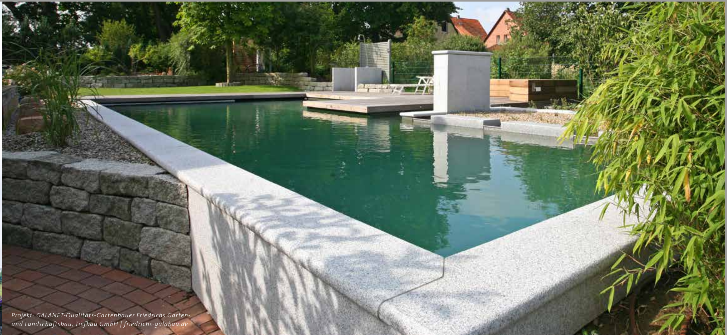
Projekt: GALANET-Qualitäts-Gartenbauer Friedrichs Garten- und Landschaftsbau, Tiefbau GmbH | friedrichs-galabau.de