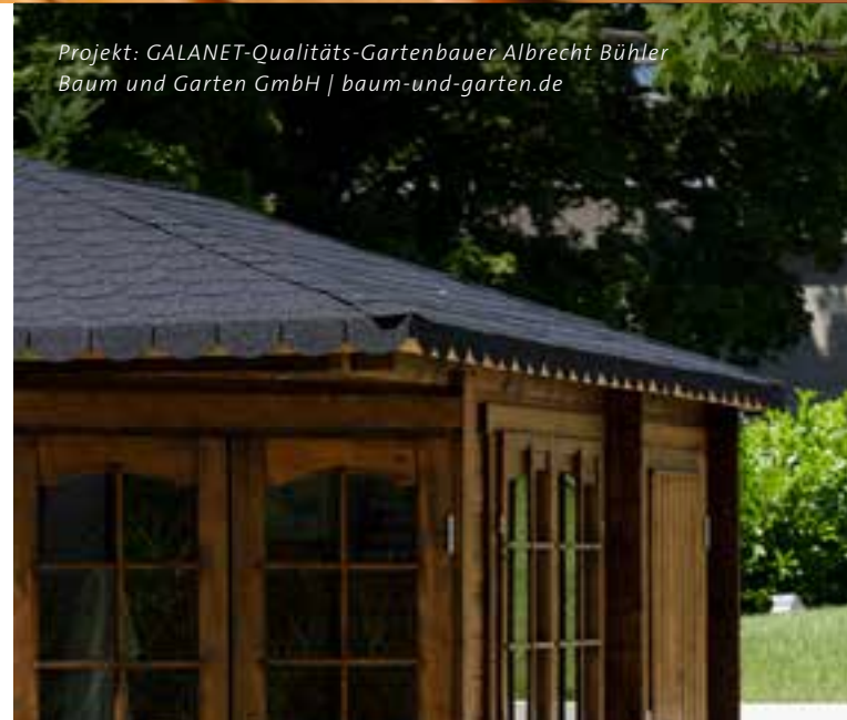
Projekt: GALANET-Qualitäts-Gartenbauer Albrecht Bühler Baum und Garten GmbH | baum-und-garten.de

Holz bringt eine ganz natürliche Wärme in Ihren Garten. Ob in Form eines Zaunes, einer Gartenhütte oder einfach als Gestaltungselement.