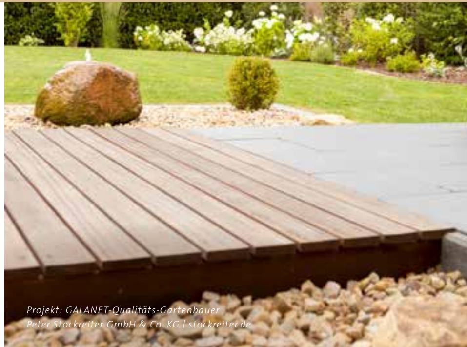
Projekt: GALANET-Qualitäts-Gartenbauer Peter Stockreiter GmbH & Co. KG | stockreiter.de

Woher der Ausdruck kommt – dazu gibt es einige Theorien. Eine ist im Schreinerhandwerk anzusiedeln. Der Schreiner muss ganz einfach darauf achten, dass sein Hobel nicht beschädigt wird, da Holzaugen, also Äste im Holz, härter sind als das restliche Holz. Die andere Theorie besagt, dass es sich um spezielle Holzkugeln in den Schießscharten von Burgmauern handelt, die beweglich sind und wie ein überdimensionales Holzauge aussehen. So oder so: Vorsicht ist geboten!