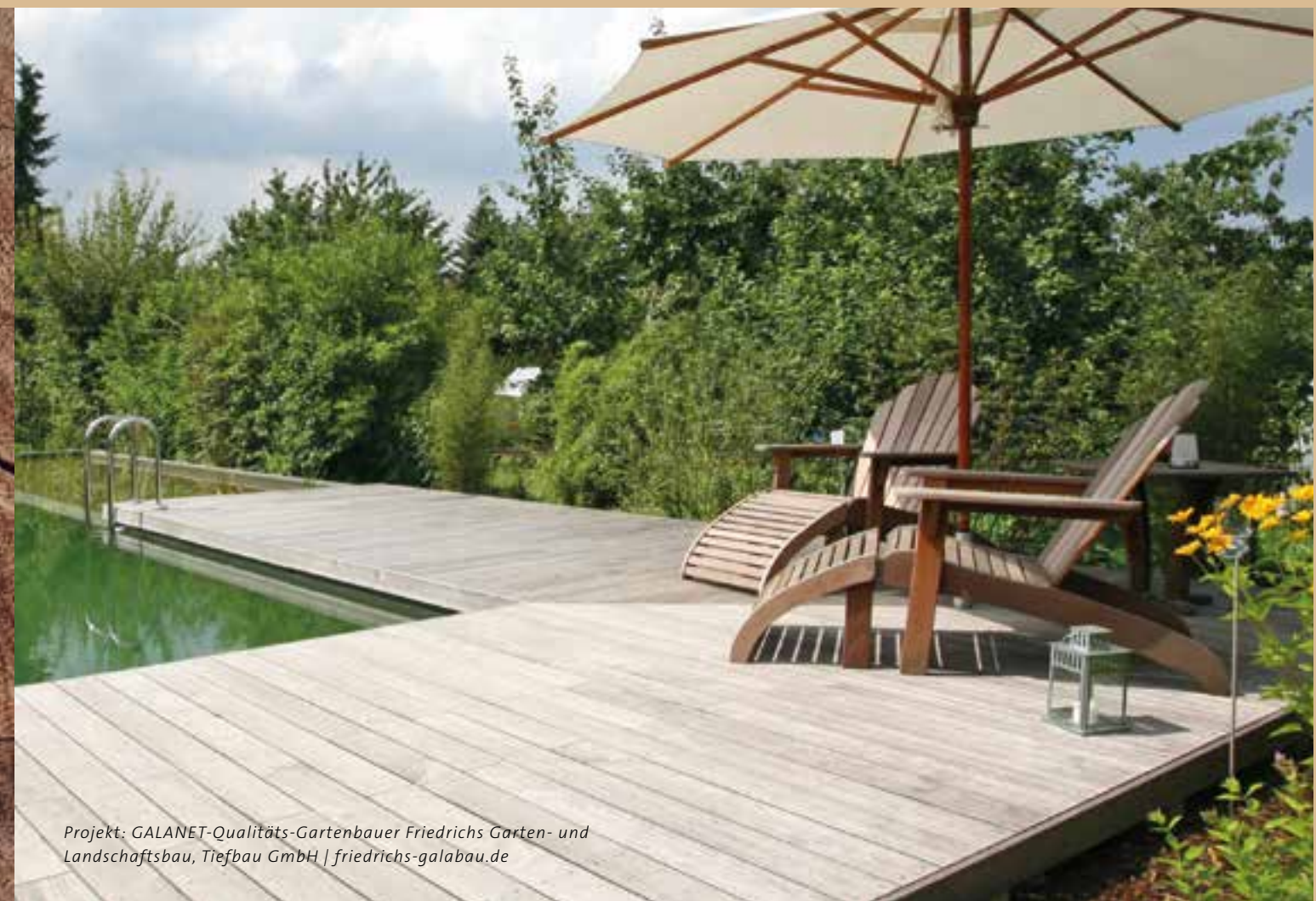
Projekt: GALANET-Qualitäts-Gartenbauer Friedrichs Garten- und Landschaftsbau, Tiefbau GmbH | friedrichs-galabau.de