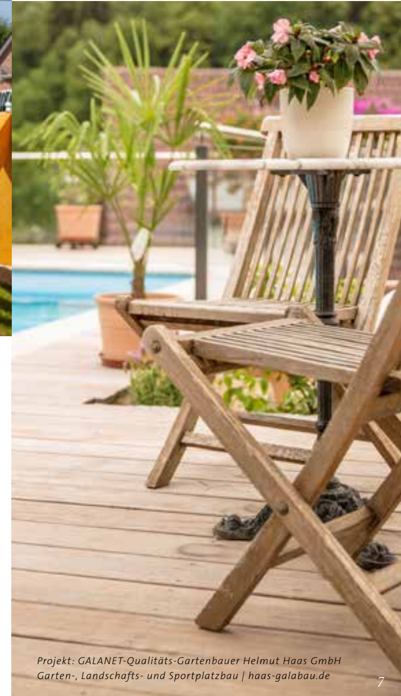
Projekt: GALANET-Qualitäts-Gartenbauer Helmut Haas GmbH Garten-, Landschafts- und Sportplatzbau | haas-galabau.de

WAS BEDEUTET EIGENTLICH HOLZ? Laut digitalem Wörterbuch der deutschen Sprache bedeutet Holz: „Gewebe und Stamm von Bäumen und Sträuchern, Baum, Wald, aus Holz gefertigter Gegenstand“. Der Ausdruck wurde im 8. Jahrhundert das erste Mal belegt und bedeutete ursprünglich „das Abgehauene, Abgeschlagene“. Klingt plausibel.