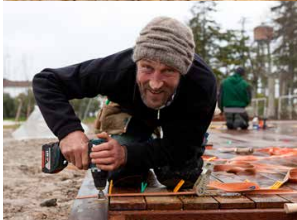
Projekt: GALANET-Qualitäts-Gartenbauer Burri & Achermann Gartenbau AG | burri-achermann.ch