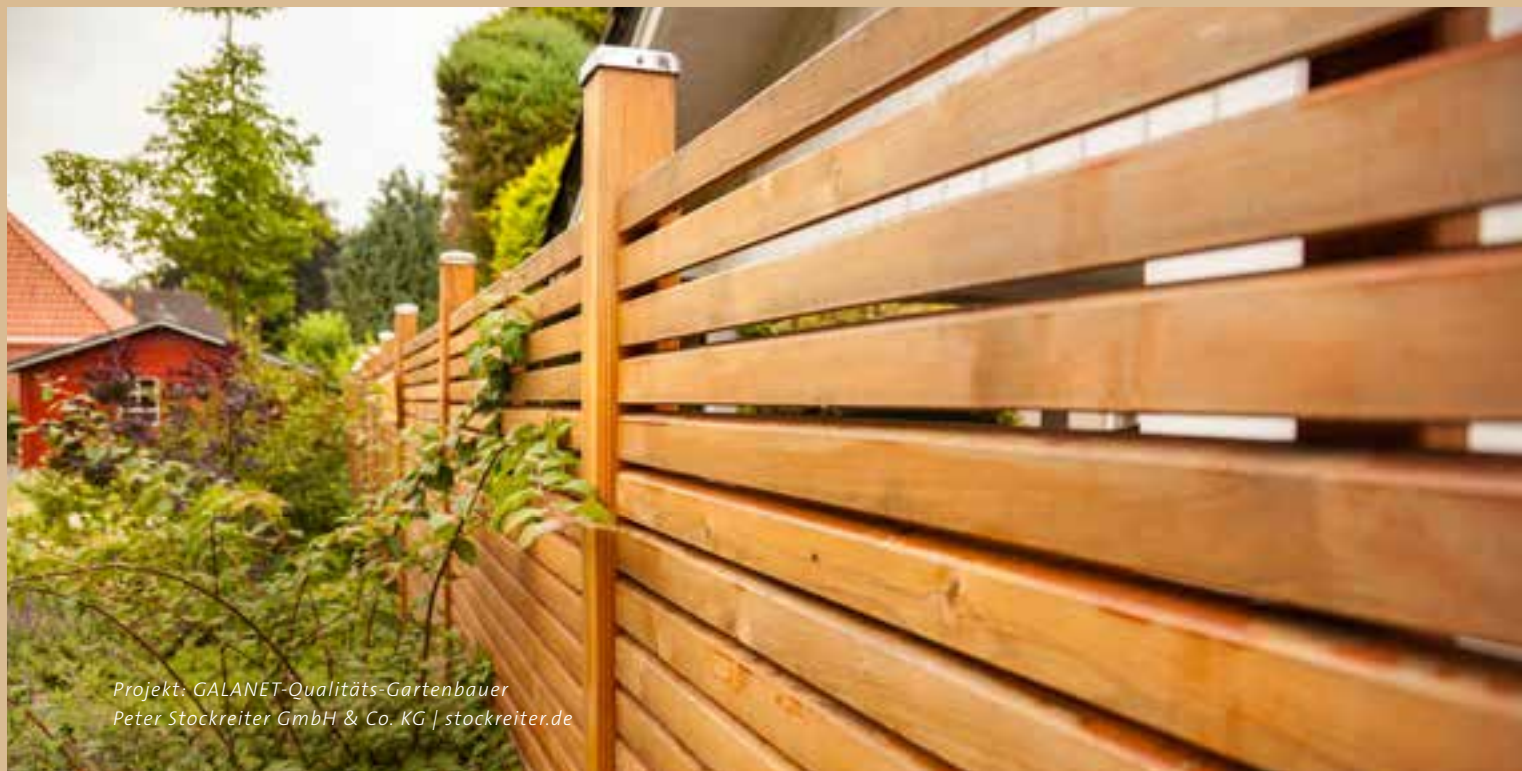
Projekt: GALANET-Qualitäts-Gartenbauer Peter Stockreiter GmbH & Co. KG | stockreiter.de