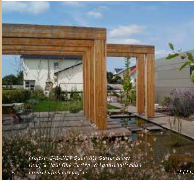
Projekt: GALANET-Qualitäts-Gartenbauer Hauf & Hauf GbR Garten- & Landschaftsbau | landschaftsbau-hauf.de