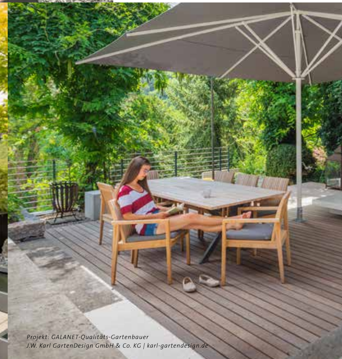
Projekt: GALANET-Qualitäts-Gartenbauer J.W. Karl GartenDesign GmbH & Co. KG | karl-gartendesign.de