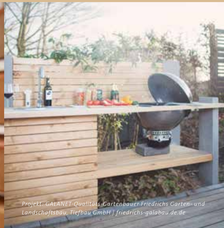
Projekt: GALANET-Qualitäts-Gartenbauer Friedrichs Garten- und Landschaftsbau, Tiefbau GmbH | friedrichs-galabau.de

Eine Outdoorküche macht sich immer gut und ist überaus prak- tisch. Ein völlig neues Grill- und Kocherlebnis.