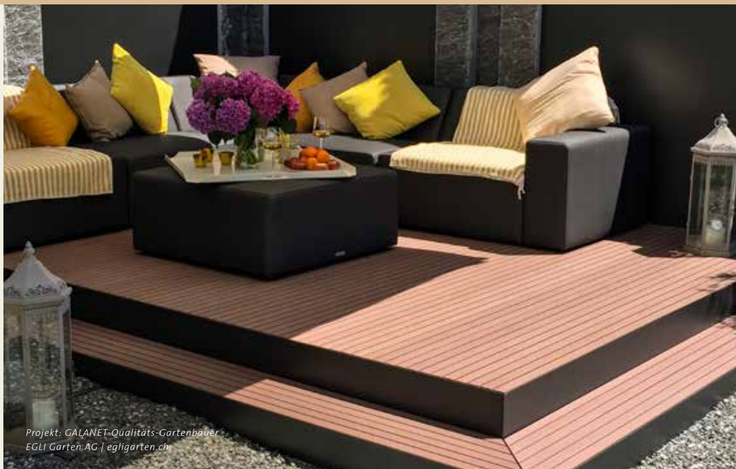
Projekt: GALANET-Qualitäts-Gartenbauer EGLI Garten AG | egligarten.ch

Ein weiteres beliebtes Material für Holzterrassen ist WPC (Wood Plastic Composite), ein Verbundstoff, der bis zu 80 % aus Holz besteht. Der Rest ist Kunststoff. Das Material ist splitterfrei, pflegeleicht und eignet sich gut als Terrassenbelag. Wenn wir eine Empfehlung unabhängig Ihrer Vorlieben abgeben müssten, wäre das Thermoholz – also thermisch behandeltes Holz. Thermoholz wird auf bis zu 230°C erwärmt, um den Zellaufbau zu verändern. Das führt zu einer verringerten Wasseraufnahmefähigkeit und einem verringerten Quell- und Schwindverhalten. Insgesamt ist das Holz langlebiger und resistenter gegenüber äußeren Einflüssen.