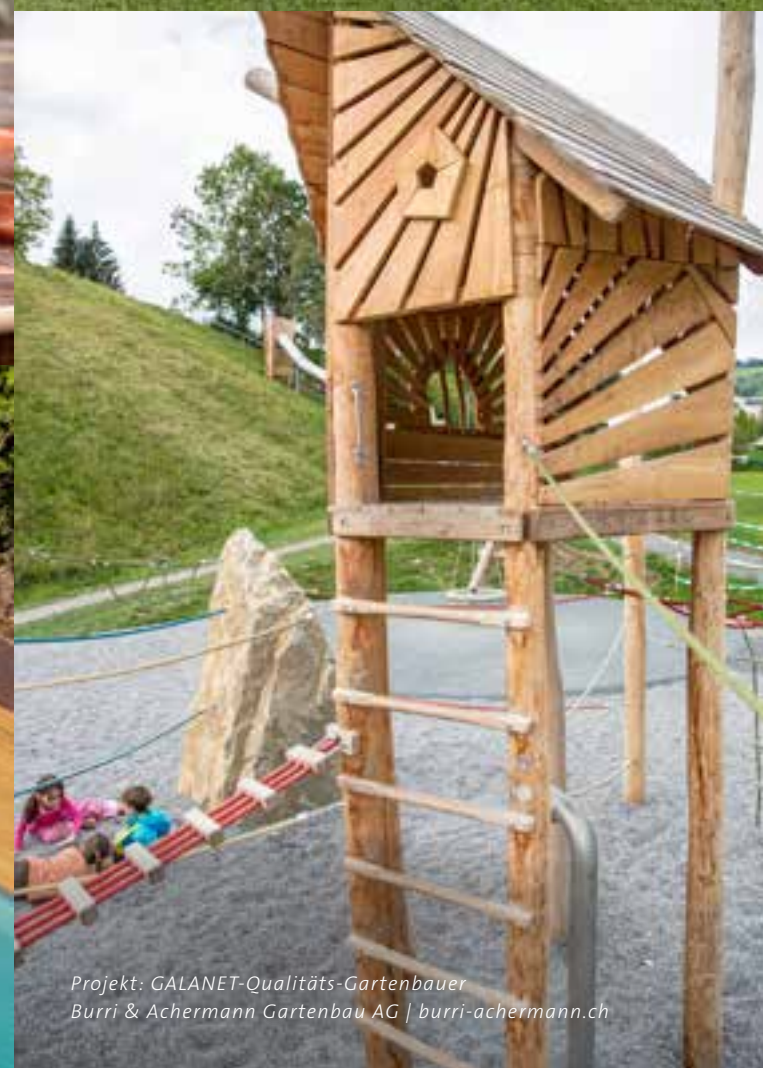
Projekt: GALANET-Qualitäts-Gartenbauer Burri & Achermann Gartenbau AG | burri-achermann.ch